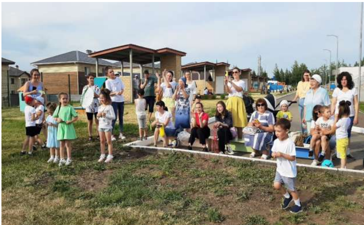
Мастер- класс по изготовлению «Воздушного змея»