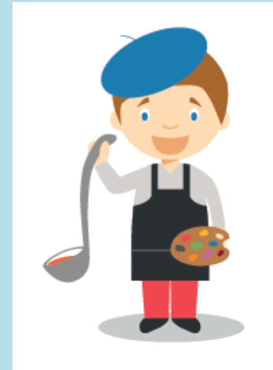
Дидактическая игра «Какие ошибки допустил художник?» (разрезные карточки)